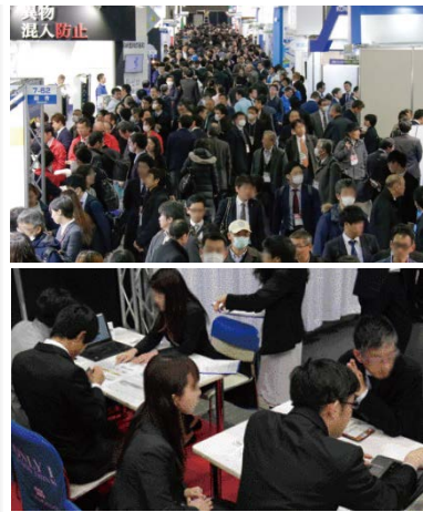
大成功となった2019年前回大阪会場の様子