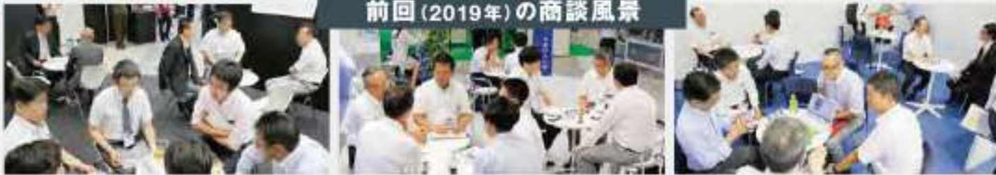
前回(2019年)の商談風景